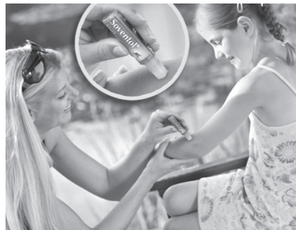
Trüben Stechmücken das sommerliche Vergnügen? Der Soventol Roll-on-Stift aus der Apotheke nimmt sofort den Juckreiz und bringt schnell die sonnige Laune zurück.

Ideal für unterwegs sind kompakte Formate wie Gel-Roller. Der auslaufersichere, zerbrechliche Soventol Roll-on-Stift findet problemlos in jeder Tasche Platz und ist sofort zur Hand, um punktgenau die Einstichstelle zu behandeln und zu kühlen. Dabei geht der Trend zu gut verträglichen Produkten für die ganze Familie, die wie der Soventol Stift auf den Einsatz von Paraben verzichten. Denn diese Konservierungsstoffe können selbst Allergien auslösen. In die Hausapotheke gehört ein kühlendes Gel mit einer sinnvollen Wirkstoffkombination. Antihistamine lindern allergische Reaktionen wie Juckreiz unmittelbar, pflegende Bestandteile fördern den Heilungsprozess. Ein Extratipp für die Dauer der Insektensaison: