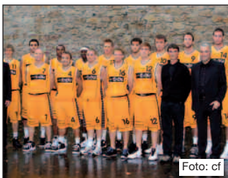
Spitzengruppe zu halten. Mehr Infos: www.kirchheim-knights.de

Auf dem Papier favorisiert wird der VfL Kirchheim Knights beim Heimspiel in der 2. Basketball-Bundesliga Pro A am Samstag, 16. Januar, gegen den TV 1862 Langen. Das Team um Knights-Headcoach Pasko Tomic wird einen Sieg in der heimischen Sporthalle in Kirchheim/Teck erringen müssen, um Kontakt zu der